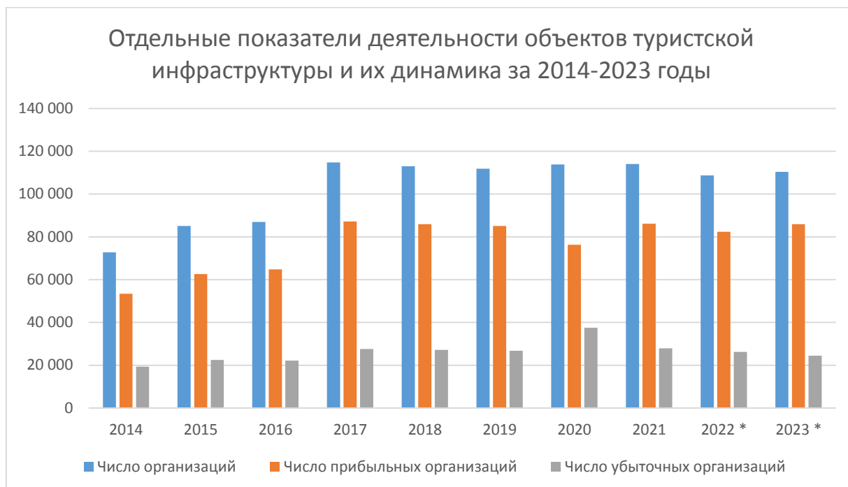
Рисунок 4 - Отдельные показатели деятельности объектов туристской инфраструктуры и их динамика за 2014-2023 годы

В заключение, можно смоделировать следующий прогноз по общей демографической ситуации в стране и в структуре туристской отрасли: