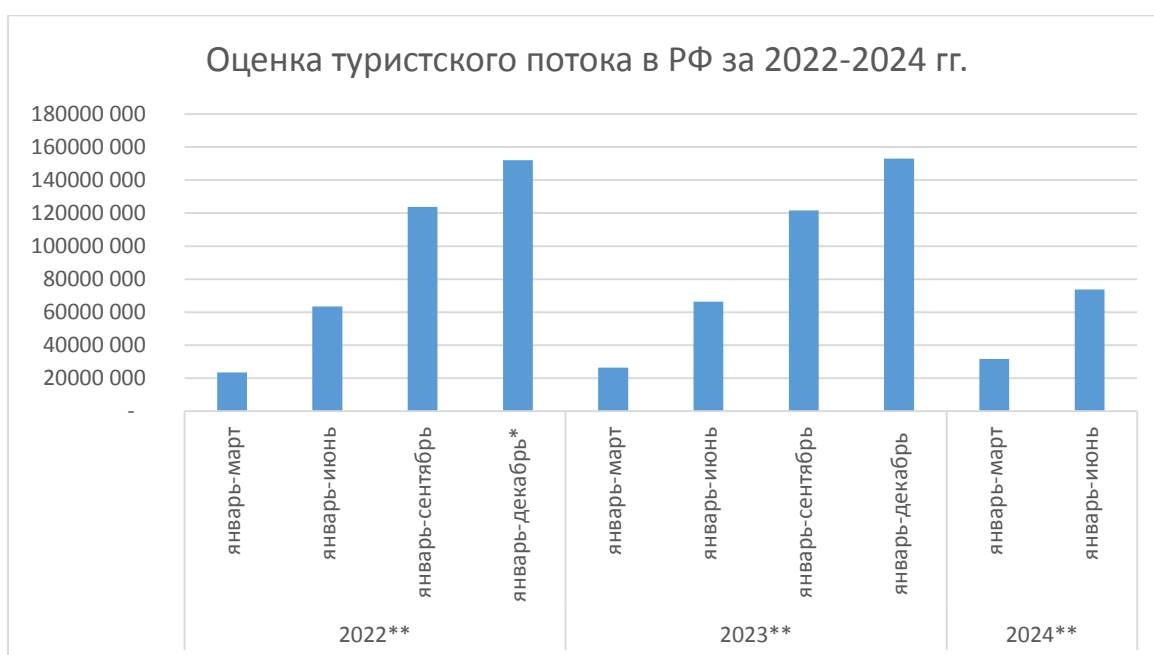
Рисунок 3 – Динамика туристского потока в 2024 году в РФ

Проанализируем официальную статистику Росстат в сфере туризма и определим текущее состояние российского туризма, для анализа изменений туристских практик в геополитических реалиях и поиска причин на данную трансформацию. На Рисунке 3 представлена динамика туристского потока за 2022-2024 гг. Исходя из представленных данных, за период 2022-2023 года отмечается отрицательна динамика прироста, если делать вывод о перспективах роста туристского потока за 2024 год, можно предположить положительный рост показателя, основываясь на сравнительном анализе периодов января-июня с 2022 по 2024 год, так как с каждым годом Россия импортозамещает различные отрасли экономики, в частности, развивает внутренний туризм и оказывает меры государственной поддержки, предлагает национальные проекты.